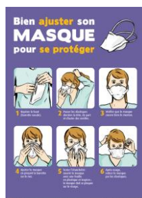
INRS Affiche « bien ajuster son masque »