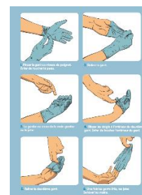
INRS Affiche « retirer ses gants à usage unique en toute sécurité »